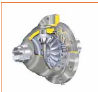
Différentiel à glissement limité FAM