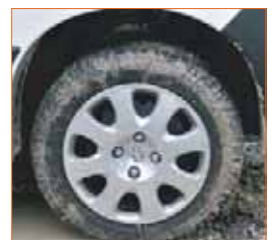
Pneumatiques "Tous Chemins"