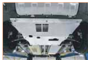
Protections sous moteur et sous caisse