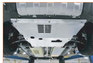
Protections sous moteur et sous caisse