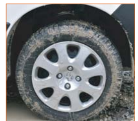
Pneumatiques "Tous Chemins"