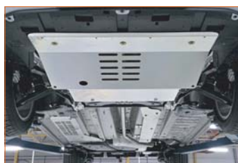
Protections sous moteur et sous caisse