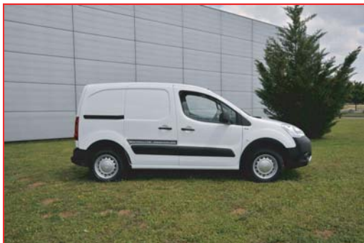
Adhésif latéral "Motricité Renforcée"