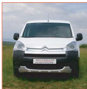
Protection de pare-chocs