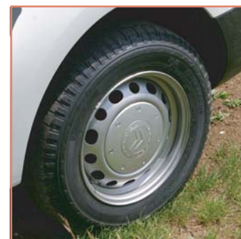
Pneumatiques "Tous Chemins" ou "Tous Temps"