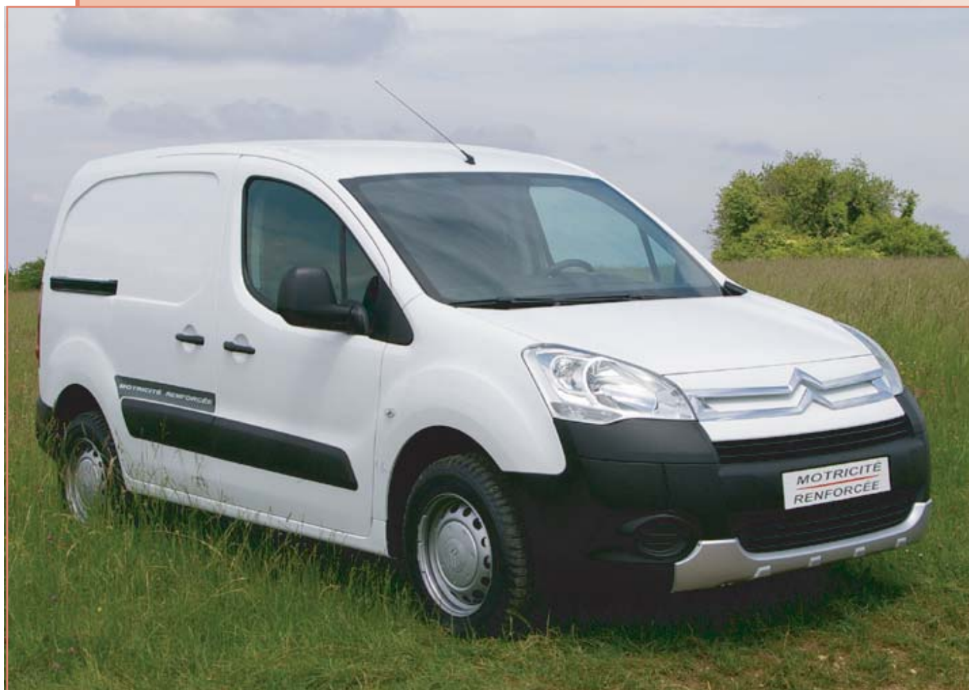
Transmission 4x2 avec différentiel à glissement limité