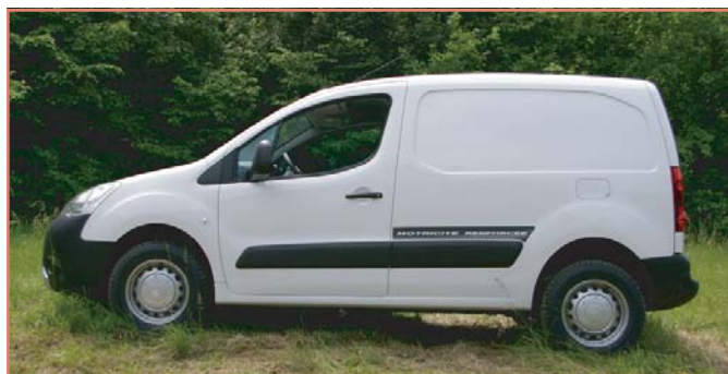
Adhésif latéral "Motricité Renforcée"