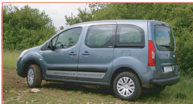
Adhésif latéral "Motricité Renforcée"