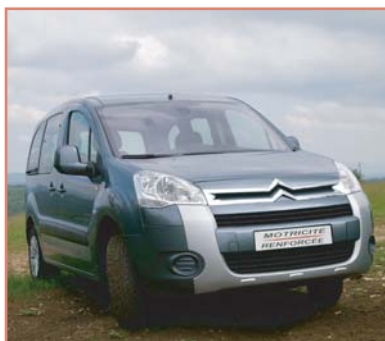
Protection de pare-chocs