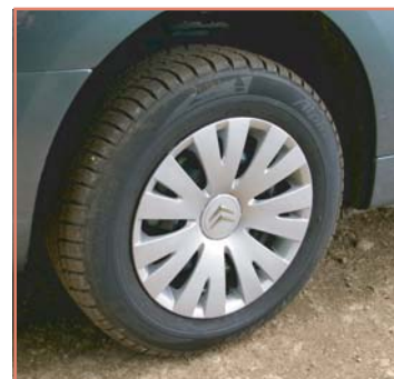
Pneumatiques "Tous Chemins" ou "Tous Temps"