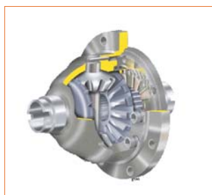
Différentiel à glissement limité