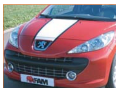
Décoration de capot