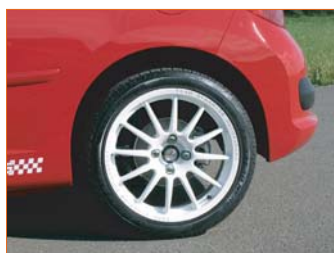
Jantes F-Racing 17"