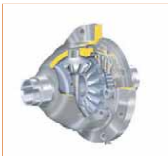
Différentiel à glissement limité FAM