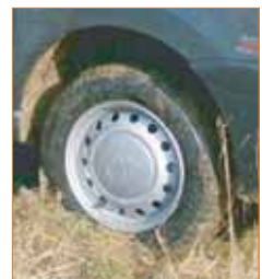
Pneumatiques "Tous Chemins"