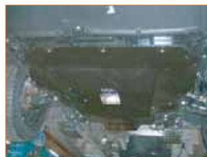
Protection sous moteur et sous caisse