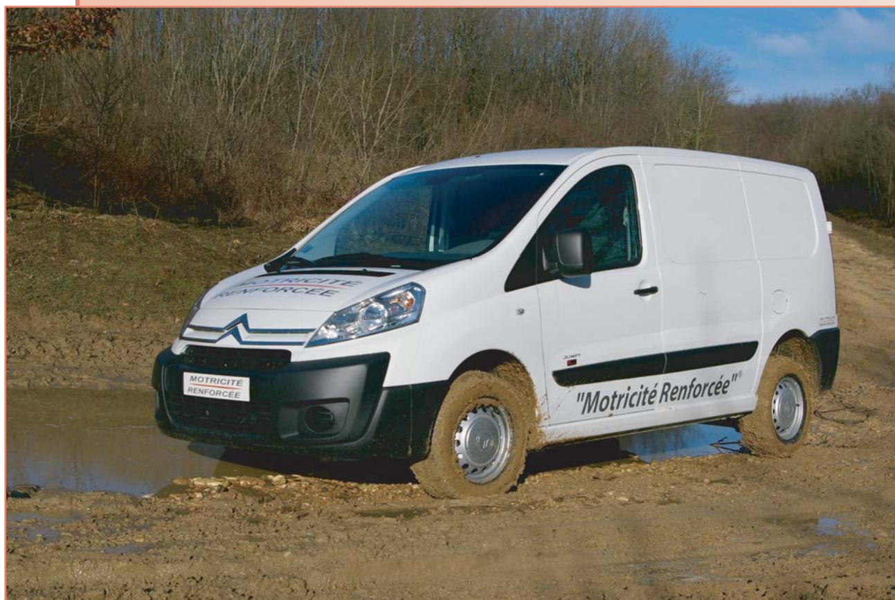
Transmission 4x2 avec différentiel à glissement limité