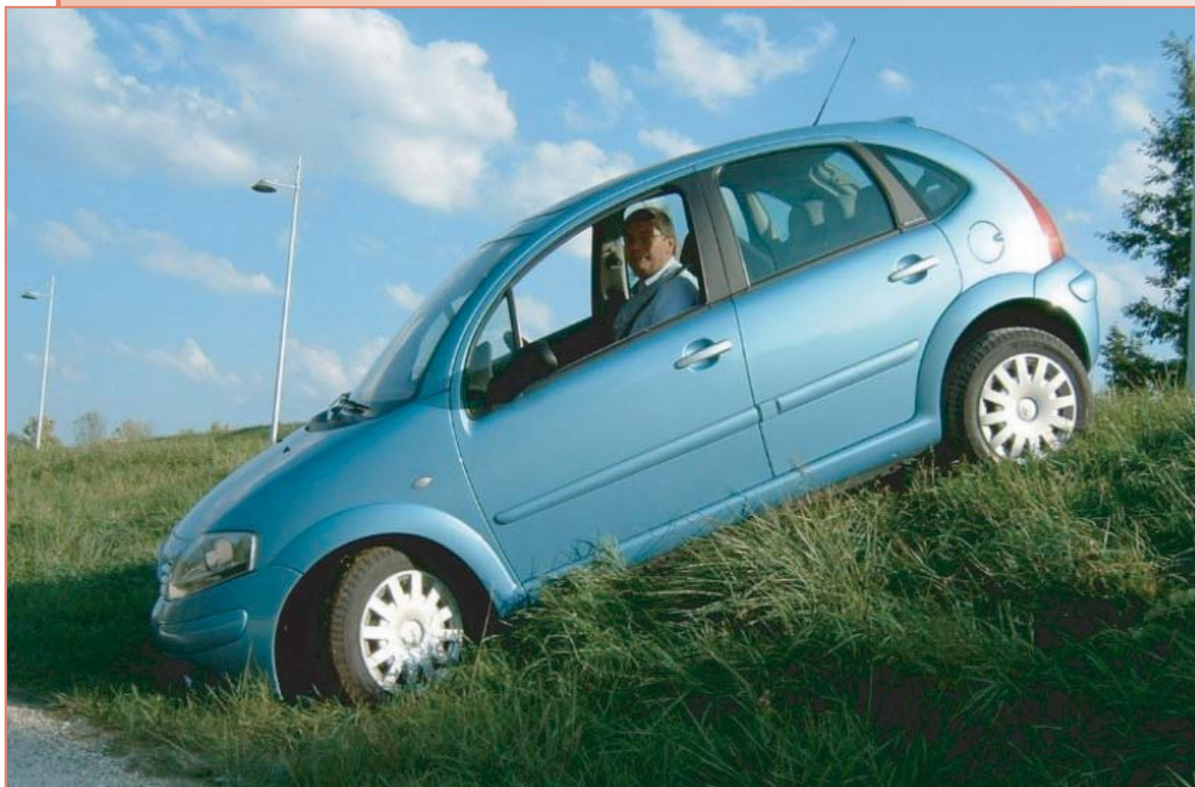
Transmission 4x2 avec différentiel à glissement limité